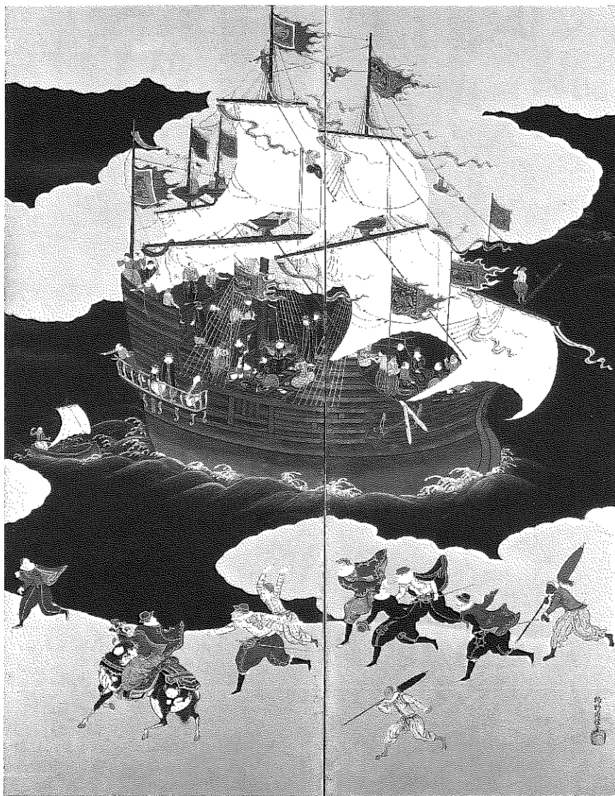
15. 狩野内膳筆 南蛮屏風