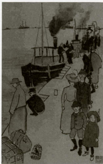
赤松麟作《神戸 波止場》

懐かしい空気と新たな発見に満ちたこれらの作品群の中で、100年近い昔となる大正期の阪神間への小旅行をどうぞお楽しみください。