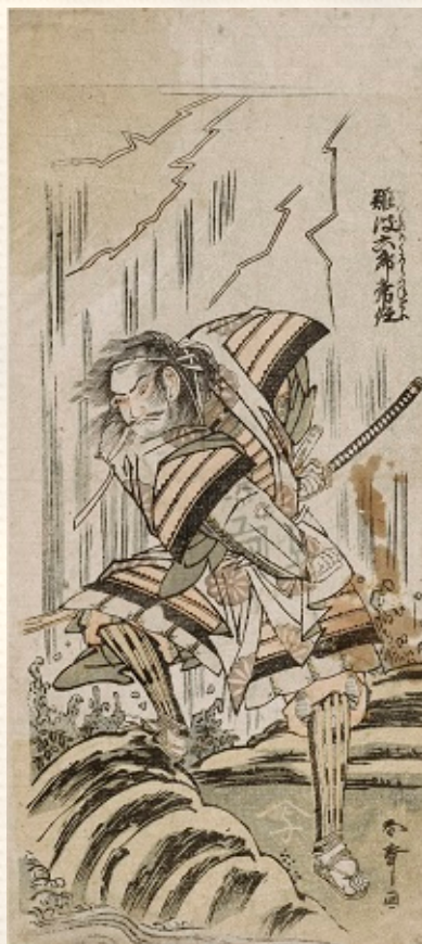
William Sturgis Bigelow Collection