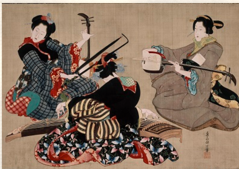
William Sturgis Bigelow Collection

ン美術館以外に遺存例が確認されていない貴重なものです。この本の表題は、四季の中で最も早く咲く梅の雅称で、新春にちなんだ狂歌を収録しています。北斎がふたつの挿図を描いています。