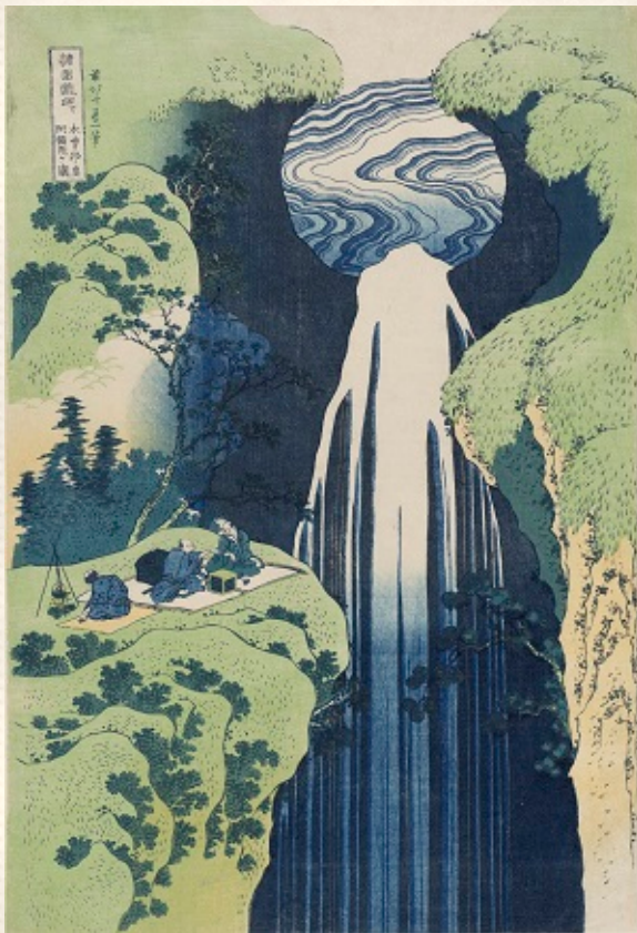
《諸国瀧廻り 木曾路ノ奥阿弥陀ヶ瀧》 天保4年（1833）頃

この春、神戸市立博物館は「ポストン美術館 浮世絵名品展 北斎」を開催いたします。